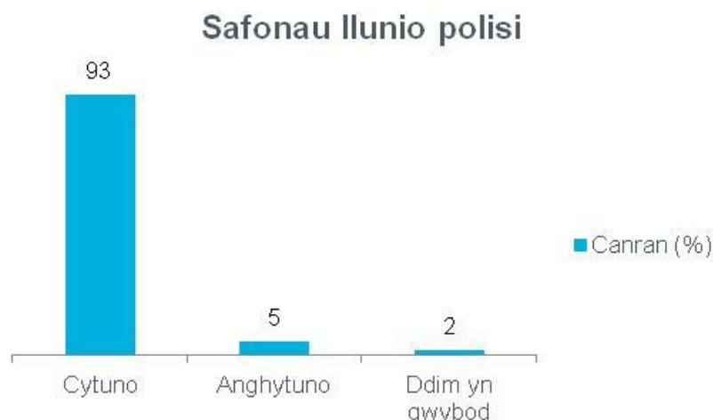
Ffigur 3 Ymateb i gwestiwn 3 yr holiadur - Safonau llunio polisi 141