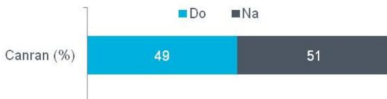
Ffigur 6 Sylwadau pellach a ddarparwyd gan aelodau'r cyhoedd

Roedd yr ymatebion a dderbyniwyd yn gyffredinol gefnogol i'r cysyniad o bennu safonau, a hynny er mwyn sicrhau hawliau clir i siaradwyr Cymraeg mewn perthynas â'r gwasanaethau Cymraeg a ddarperir gan yr holl sefydliadau sydd wedi eu cynnwys yng nghylch 2.