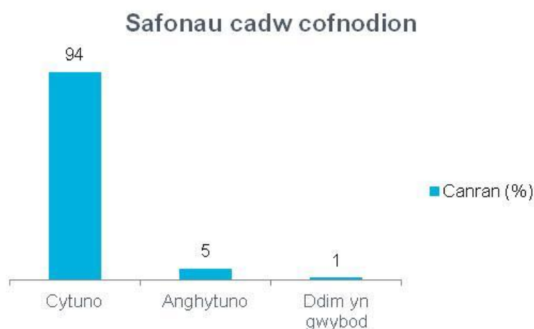
Ffigur 5 Ymateb i gwestiwn 5 yr holiadur - Safonau cadw cofnodion 143

Dengys y ffigur isod sut yr ymatebodd aelodau'r cyhoedd i'r cwestiwn hwn: