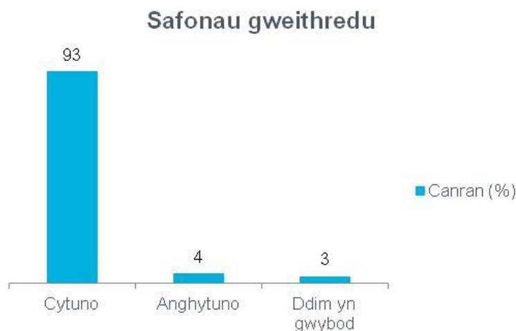
Ffigur 4 Ymateb i gwestiwn 4 yr holiadur - Safonau gweithredu 142

Dengys y ffigur isod sut yr ymatebodd aelodau'r cyhoedd i'r cwestiwn hwn: